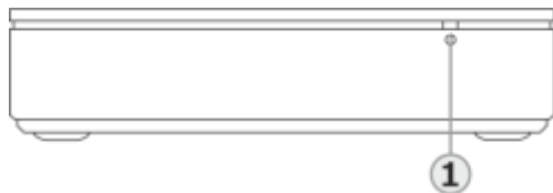
1 Индикатор питания